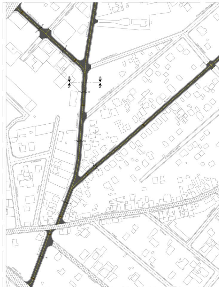
1 - Planta de Pavimentação TRECHO A Escala 1:1000