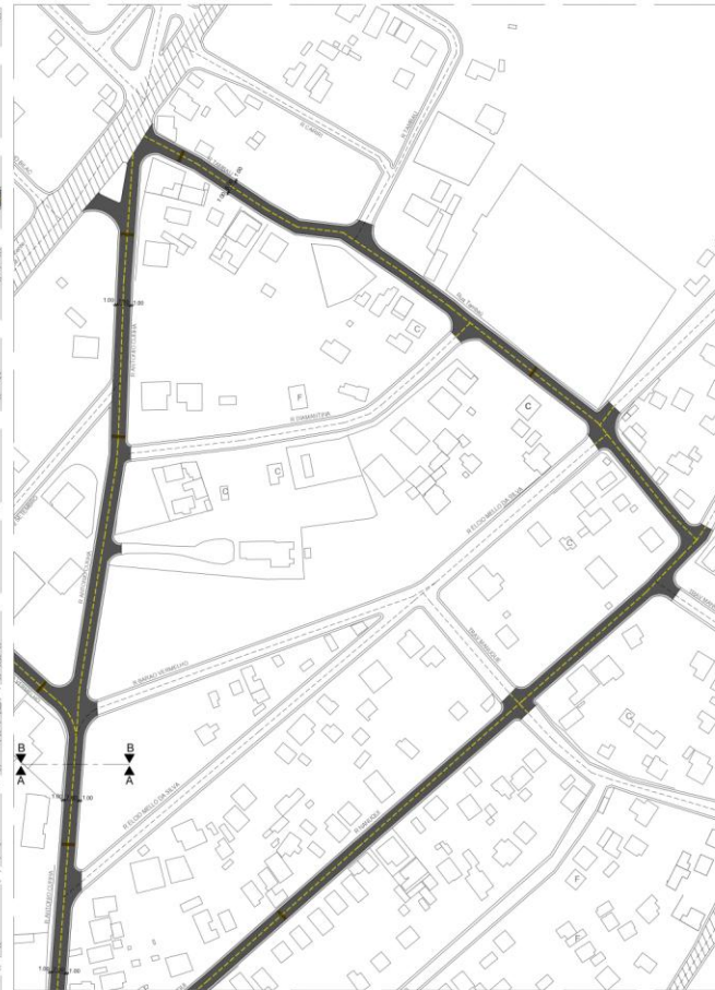
2 - Planta de Pavimentação TRECHO B Escala 1:1000